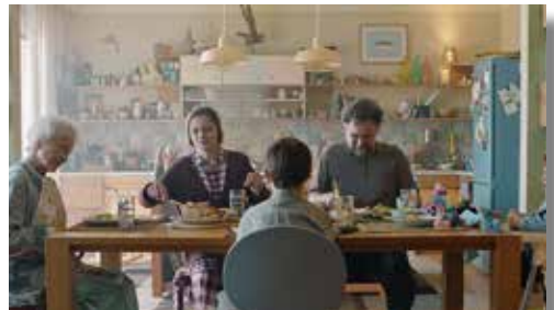
Ein bisschen bleiben wir noch