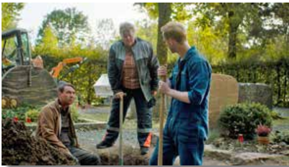
Wer gräbt den Bestatter ein?